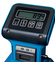
Abbildung zeigt Waage mit optionalem Drucker