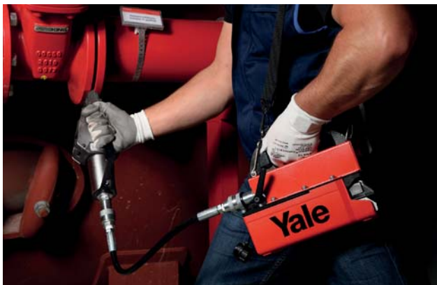
Idealer Einsatz im Zusammenhang mit kompakten, portablen Hydraulikwerkzeugen wie Spreizern, Hebekeilen, Kurzhub- und Flachzylindern sowie Mutternsprengern