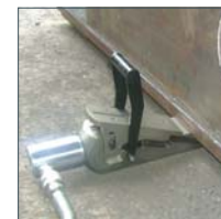
Hebekeil Modell HK-16T, 16t