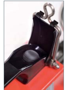
Einhandbedienung Bedientaster im ergonomisch geformten Tragegriff integriert.