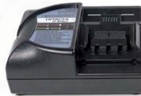
Schnell-Ladegerät Modell PYB-CHARG