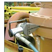
Spreizkeil Modell YSW-14T, 14t

ND = Niederdruckstufe (Leerhub, d.h. Ausfahren ohne Last) HD = Hochdruckstufe (Lasthub)