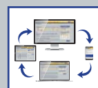
Service- und Dienstleistungen

Wie freuen uns auf Ihre Anfrage und richten gerne ein personalisiertes Angebot an Sie.