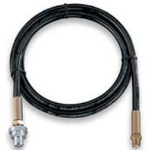
Hydraulik-Schläuche Modell HHC