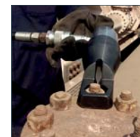
Mutternsprenger Modell YNS/YNS-AH, SW 11-89mm