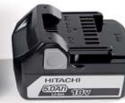
Akku Modell PYB-BAT