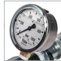
Optionale Ausstattung mit Manometersatz Modell GYA-63