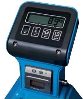
Abbildung zeigt Waage mit optionalem Drucker