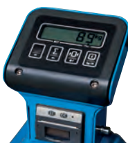
Abbildung zeigt Waage mit optionalem Drucker