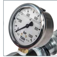
Optionale Ausstattung mit Manometersatz Modell GYA-63