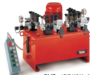
PMF - 15/3/40/4x4E

zum synchronen (druckunabhängigen und gleichzeitigen) Ausfahren von 4 Hydraulikzylindern, angesteuert durch eine Kabel-Fernbedienung, welche ein hohes Maß an Beweglichkeit der Bedienungsperson sicherstellt. Die Elektromagnetventile mit zusätzlichen Drosselrückschlagventilen erlauben ein sehr genaues Ansteuern und gefühlvolles Absenken der angeschlossenen Hydraulikzylinder.