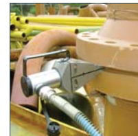
Spreizkeil Modell YSW-14T, 14t

ND = Niederdruckstufe (Leerhub, d.h. Ausfahren ohne Last) HD = Hochdruckstufe (Lasthub)