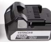
Akku Modell PYB-BAT