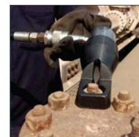
Mutternsprenger Modell YNS/YNS-AH, SW 11-89mm