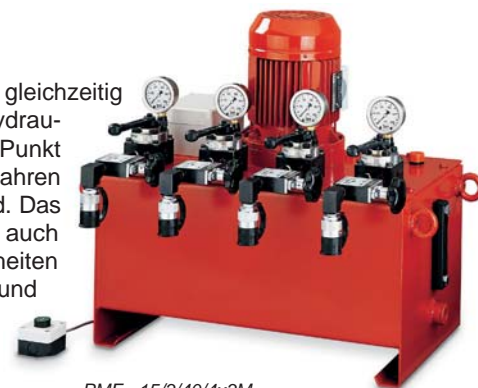
PMF - 15/3/40/4x3M

Diese Mehrstrom-Elektro-Hydraulikaggregate bieten die Möglichkeit 4 Hydraulikzylinder gleichzeitig und zwangsweise mit der gleichen Ölmenge auszufahren. Hierdurch ergibt sich ein hydraulischer Gleichlauf. Schwere Lasten wie z.B. Maschinen können von einem zentralen Punkt durch eine „Ein-Mann-Bedienung“ synchron angehoben werden. Ein synchrones Ausfahren ist auch möglich, wenn die Auflasten auf den einzelnen Hydraulikzylindern ungleich sind. Das Anheben erfolgt auf Knopfdruck, wobei die Hydraulikzylinder sowohl gemeinsam als auch einzeln ansteuerbar sind (Nivellieren einer Last). Das Absenken der einzelnen Hubeinheiten erfolgt durch das Öffnen der aufgebauten Feindrosselventile. Die griffigen Handräder und die günstige Regelcharakteristik dieser Ventile lassen ein millimetergenaues Absenken zu. Als Hubeinheiten können alle Hydraulikzylinder, Stufenheber oder Maschinenheber eingesetzt werden.