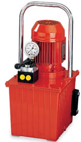
Mini-Hydraulikaggregat Typ PYE – 03/3/10/3 M einstufige, kompakte und preiswerte Mini-Hydraulikpumpe mit Handventil-Steuerung