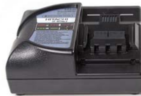
Schnell-Ladegerät Modell PYB-CHARG