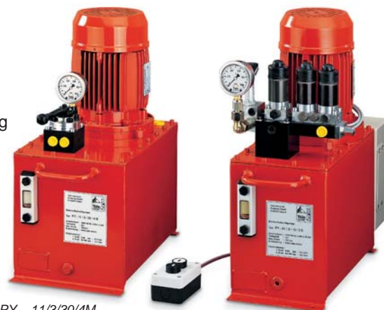
PY - 11/3/30/4M