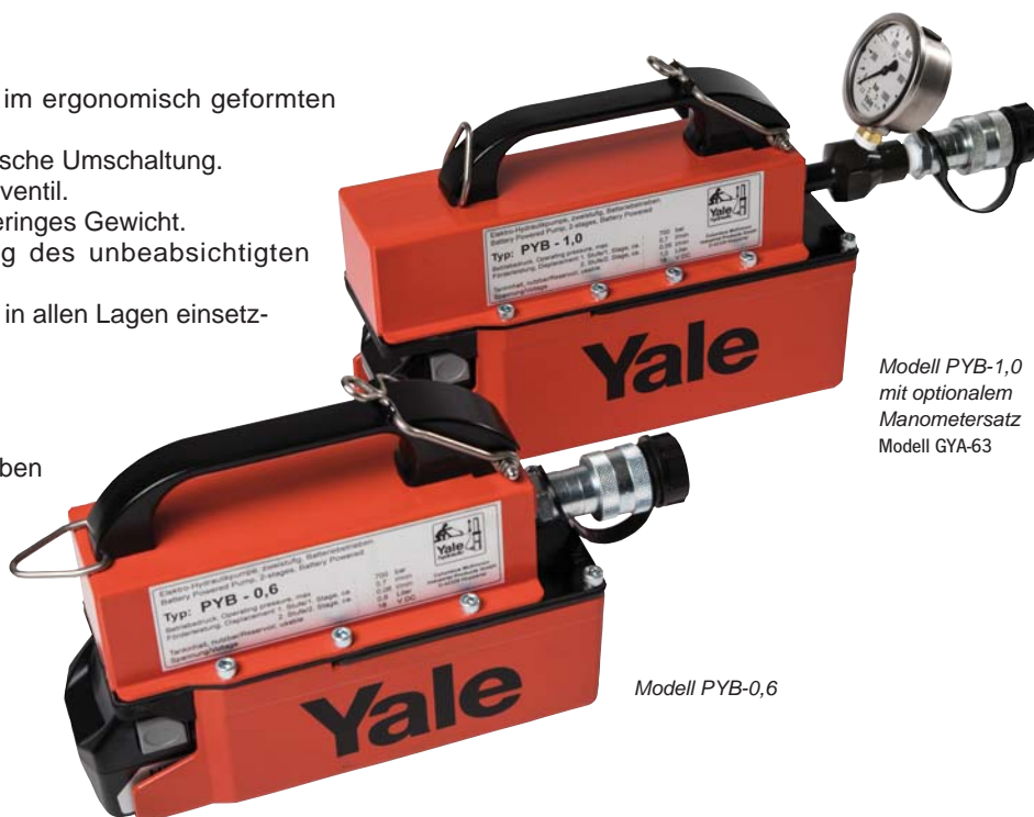
Modell PYB-1,0 mit optionalem Manometersatz Modell GYA-63