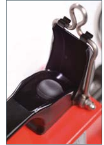
Einhandbedienung Bedientaster im ergo- nomisch geformten Tragegriff integriert.