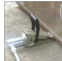
Hebekeil Modell HK-16T, 16t